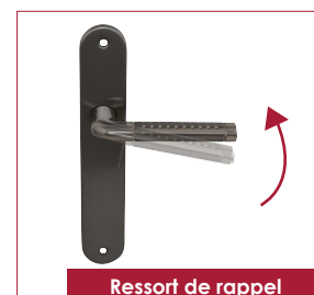
Ressort de rappel